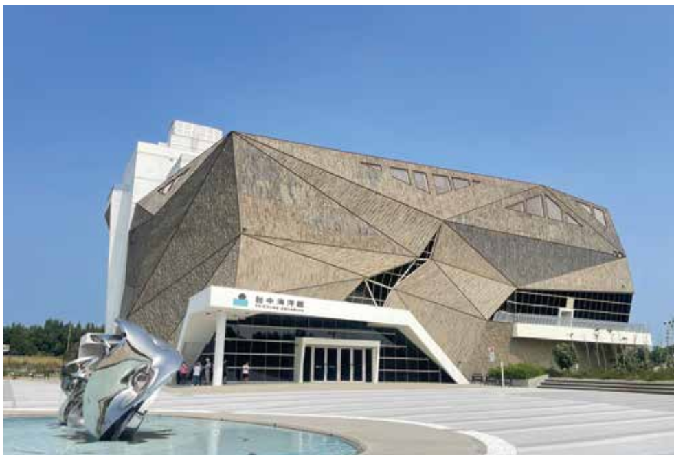
台中海洋館（清水區）