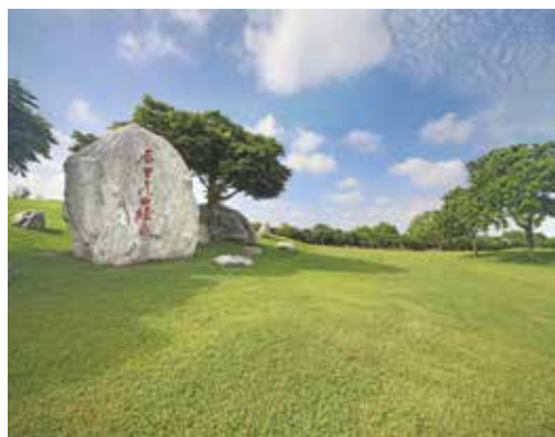
封面照片 后里區-后里花田綠廊