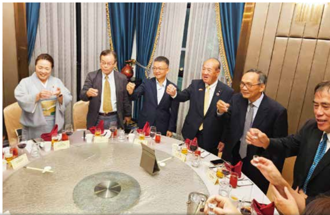
日本金澤市議會前誠一議長等人拜會晚宴餐敘